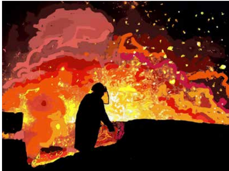
Illustratie: Wies Tesselaar